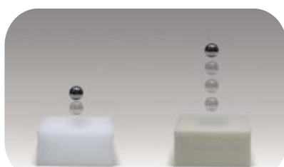
一般フォーム 高弾性フォーム