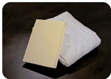
シーツ・パット2点パック プリモ No.0102025 税込 ¥19,800 (本体価格 ¥18,000) 1個口 仕様/シーツ綿100% (パット)側生地:ポリエステル65%・綿35% 詰物:ポリエステル100%

一般的なウレタンと比較して硬さの低下、へたりが少なく耐久性に優れています。コイルレスにする事で軽量化を実現し、日々のメンテナンスにも優れます。また、コイルを使用していないため、廃棄の際にはご自宅で粉砕して一般廃棄物として扱うことが可能です。