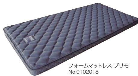
フォームマットレス プリモ No.0102018 税込 ¥96,800 (本体価格 ¥88,000) W1980xD980xH100mm 重量9kg/1個口