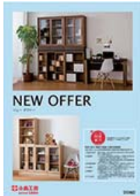
ニューオファー (A4 二つ折り)