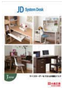
J.zone JD (A4 冊子)