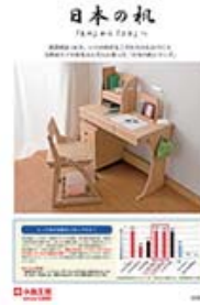
日本の机 (A4 二つ折り)