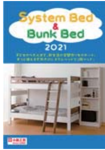
システムベッド&2段ベッド (A4 冊子)