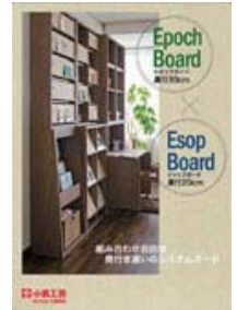
Epoch Board +Esop Board (A4 冊子)