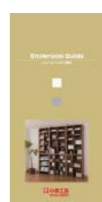
ショールーム ガイド