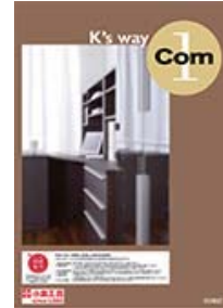
K's way Com1 (A4 二つ折り)