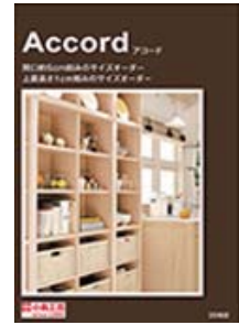
アコード (A4 観音折り)