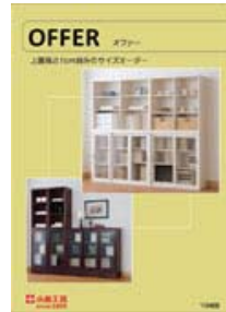
オファー (A4 二つ折り)