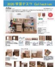
2019学習デスク コレクション