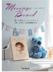
message board メッセージボード (A6)