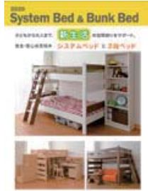
システムベッド&2段ベッド (A4 冊子)