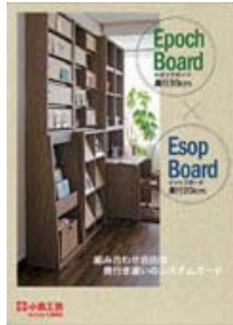
Epoch Board+Esop Board (A4 冊子)