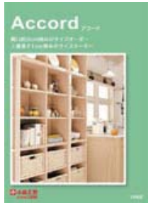
アコード (A4 観音折り)