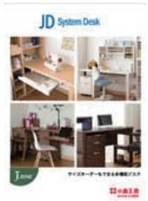
J.zone JD (A4 冊子)