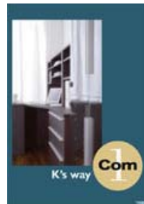
K's way Com1 (A4 二つ折り)