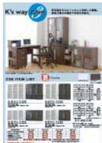
C3B (A4 タテ)