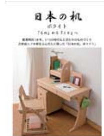
日本の机 ポライト (A4 二つ折り)