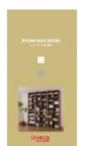
ショールーム ガイド