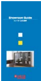
ショールームガイド