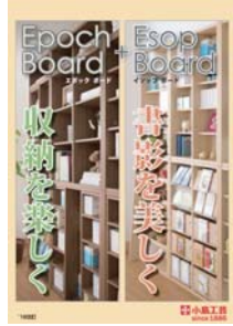
Epoch Board + Esop Board (A4 冊子)