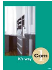
K's way Com1 (A4 二つ折り)