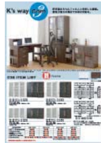
C3B (A4 タテ)