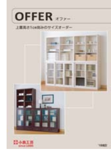
オファー (A4 二つ折り)