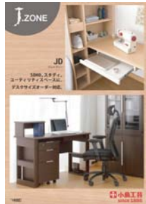
J.zone JD (A4 冊子)