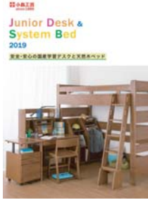
学習デスク・システムベッド (A4 冊子)