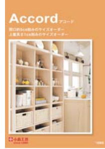
アコード (A4 観音折り)