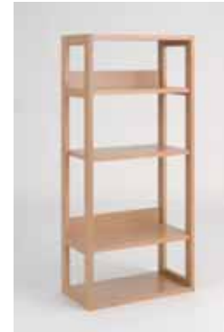
GD-02 シェルフ W600×D330×H1340