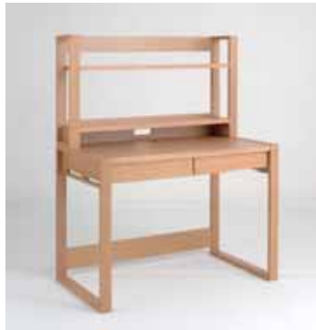
GD-02 デスクセット デスク：W1050×D600×H740 ワゴン：W240×D480×H570