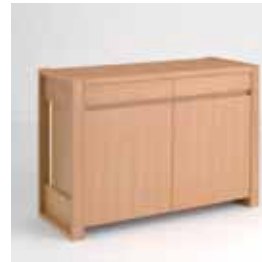
GD-02 キャビネット W1050×D420×H740